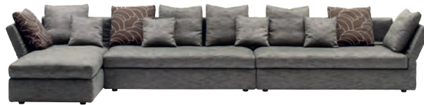
Mondo Elementgruppe eines von über 30 Polstermöbelmodellen in der Kollektion der Neuen Wiener Werkstätte