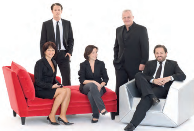
Familie Polzhofer: Das Familienunternehmen KAPO und Neuen Wiener Werkstätte ist bereits in der 4. Generation

Öffnungszeiten: Montag bis Freitag von 09-19 Uhr und Samstag von 09-17 Uhr Auch außerhalb der Öffnungszeiten nach telefonischer Vereinbarung unter 0664/8110860