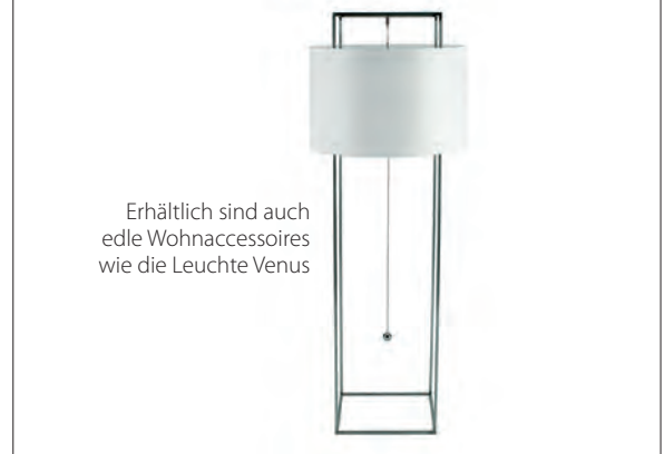
Erhältlich sind auch edle Wohnaccessoires wie die Leuchte Venus

Erhältlich sind Produkte der Neuen Wiener Werkstätte österreichweit im gehobenen Fachhandel. Alle Infos unter www.neuwienerwerkstaette.com